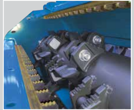
Rotore con supporti dentati con 3 controcoltelli dentati Rotor with toothed supports with 3 toothed counter-knives

For shredding pruning residues without stepping on the windrows