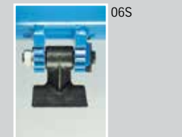
Mazza pesante: legna Heavy hammer: wood