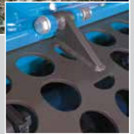
Doppia griglia calibrata Double calibrated grid